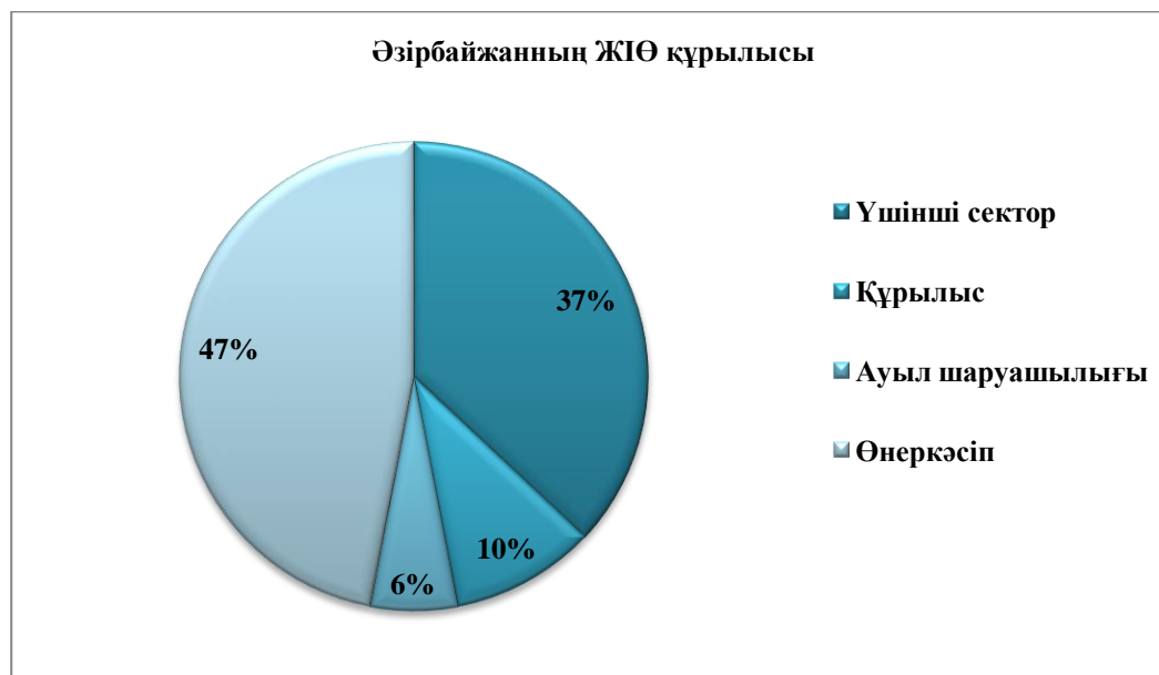
1-сурет - Әзірбайжан Республикасының ЖІӨ құрылысы

Өнеркәсіп орындарының үлес салмағы 40% дейін жетіп, бұрынғы посткеңестік мемлекеттердің арасында ең жоғарғы көрсеткішті көрсетіп отыр. Оны төмендегі суреттен көруге болады.