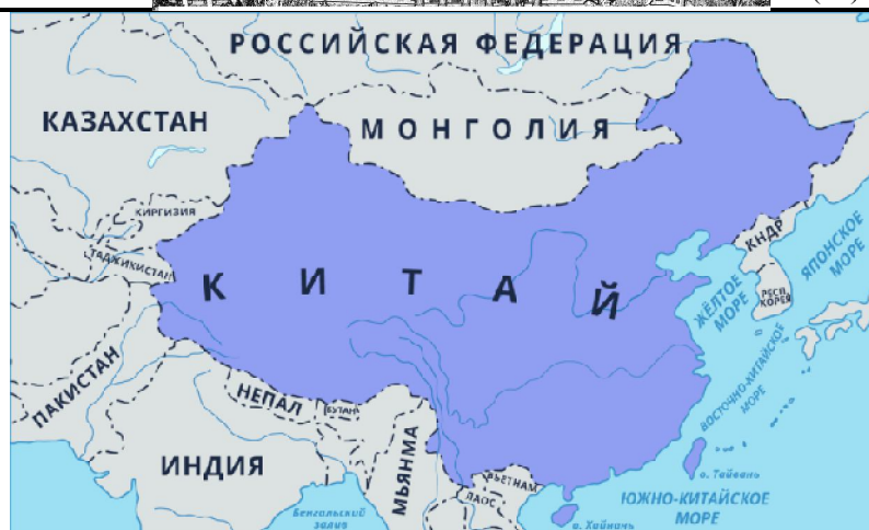
Рисунок 3 – Китайская Народная Республика [8]

Суммативное оценивание за раздел было проведено в 10 классе, всего учащихся 28, писали сор 28. В СОР были включены 4 задания по разделу «Геоэкономика», всего 14 баллов (таблица 3). На графике показана динамика усвоения материала по разделу «Геоэкономика» (Рисунок 4).