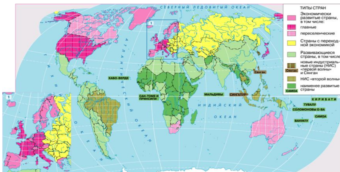
Рисунок 2 - Карта «Типы стран мира по уровню экономического развития» [8]

Задание №3. Проанализируйте карту «Типы стран мира по уровню экономического развития» приведите 2 примера развитых, страны с переходной экономикой, ключевые развивающиеся страны (Рисунок 2).