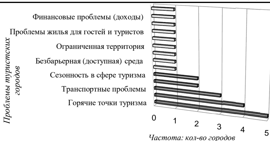
Рис.1 - Распределение проблем по количеству анализируемых туристских городов, ед. (табл.1)