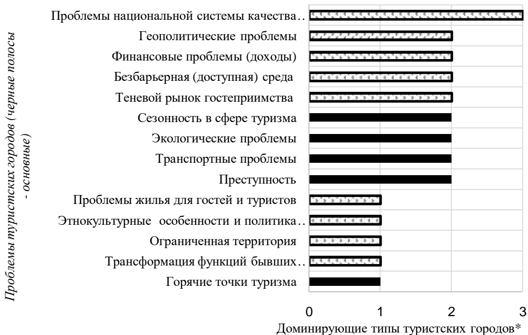
Рис. 2 - Распределение проблем по доминирующим типам туристских городов (табл.1–2). Описание типов см. в примечании табл.2.

В табл.3 представлен вариант функциональной систематизации разнообразных проблем анализируемых туристских городов. Если проблемы рассматривать как результат влияния туризма на городское пространство, то их можно объединить в группы пространственных (географических) функций. Удалось свести 14 проблем туристских городов к 5-ти пространственным функциям городского туризма. Это значит, что доминирующими проблемами в пространственном устройстве туристских городов являются размещенческие, диспозиционные и структурирующие (рис.3). В каждом конкретном туристском