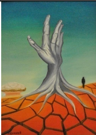
5- сурет К. Күйіковтың «Қоштасу сәті. Прощальный стон» картинасы[29].

Бұл туындыны тіршілік ету, күрес және адамның теріс әрекетінің салдары ретінде түсіндіруге болады. Шығармада адамның өткен өмірімен қоштасуын, қиын сәттерді артқа қалдырып, жаңа бір кезеңге қадам басу мен жаңа өзгерістерге дайындығын бейнелейді. Суретте адамның эмоциялары, ішкі күйзелісі, қимылдары арқылы оның жаңа жолға, жаңа бастамаға ұмтылуы суреттеледі. Картинада ядролық жарылыс пен жалғыз адам силуэті бейнеленген. Автор картинасында әр элемент, әр сызық, түстердің қолданылу тәсілі көрерменге терең ой салады. Өткеннің ауыртпалықтары мен болашаққа деген белгісіз үміт арасындағы білінбейтін шекара көрсетілген. Бұл шығарма адамның өз өміріне, өткеніне және болашағына деген ерекше көзқарасын білдіретін терең өнер туындысы болып табылады.