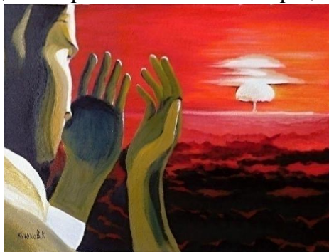
2 -сурет К.Күйіковтың «Жарылыс» картинасы [27].

К. Күйіков шығармашылығындағы маңызды туындының бірі «Жарылыс» картинасы (2 - сур.). Картинада автор Семей ядролық полигонында болған жарылыстың адамзатқа және табиғатқа әкелген зиянды әсерін бейнелейді. Бұл картина арқылы көрерменді күйзеліс пен шындықтың ауыртпалығымен бетпе-бет келтіріп, жарылыстың салдарынан туындайтын қорқынышты, әрі қасіретті жағдайды ұғындыруға тырысады. 2016 жылы аталмыш картинаны Қазақстанның Тұңғыш Президенті Нұрсұлтан Назарбаев «Ядролық қауіпсіздік саммиті» барысында АҚШ президенті Барак Обамаға сыйға тартқан [26].