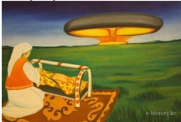
4-сурет К. Күйіковтың «Радиоактивті балалық шақ» картинасы [29].

К. Күйіковтың Семей ядролық сынақ бейнесін көрсететін тағы бір туындысы «Радиоактивті балалық шақ» картинасы (4-сурет). Шығармада алаша кілем үстіндегі бесіктегі сәбиін тербеген қазақ әйелі бейнеленген. Бұл бейне атабабадан қалған салт-дәстүрмен жалғасқан бейбіт өмірді сипаттаса, картинадағы екінші бір көрініс алаңсыз отырған халыққа сыналған ядролық жарылысты көрсетеді. Суретші бейбіт сахна көрінісі мен апат символы арасындағы қарама-қайшылық арқылы, дәстүрлі қазақ өміріне зорлық-зомбылықтың енуін бейнелейді. Қазақи нақышта киінген әйел киімінің жеңіл және жылы реңктері оның кінәсіздігі мен дәрсенсіздігін және қайғы-қасіретке қарамастан мәдениетті сақтап, жақсы болашаққа үміт артқан қазақ анасының болмысын сипаттайды.